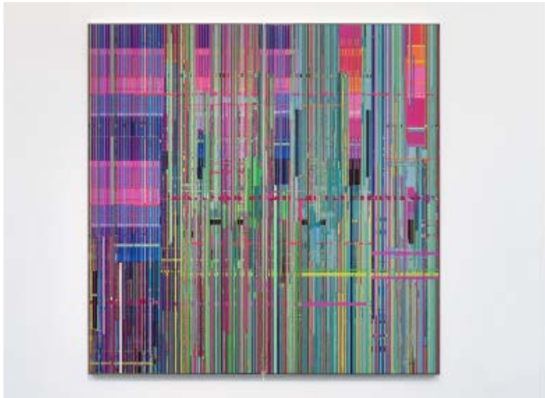
紫色空气，2014 年，绘画，160X400 厘米