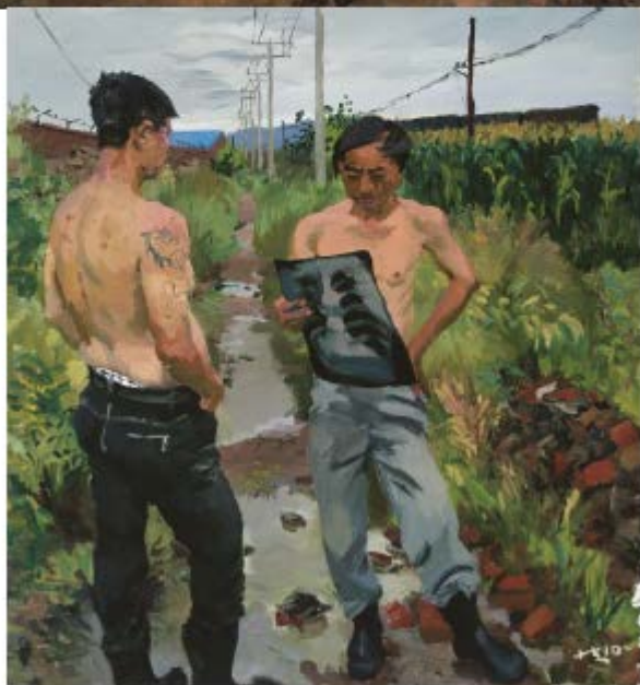
男孩故乡，2013 年，帆布油画