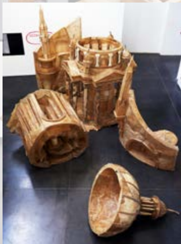
刘韡,《爱它,咬它 No.3》 2014 牛皮、木头、钢 尺寸可变

刘韡在创作作品《爱它，咬它》(2006)时，第一次使用狗咬胶作为材料。这件运用非常规媒介的作品曾在全球范围内许多具有声望和影响力的标志性场馆中展出——五角大楼、圣保罗大教堂、泰特美术馆。在一次看到一只狗在啃咬狗咬胶玩具后，刘韡便开始思考人类对权力的欲望和动物对食物的渴望之间的联系。他视他的雕塑为一种隐喻的策略，以缩短这些平行的渴望之间观念的距离。这个狗咬胶装置象征着某种结构性弱点——权力倾向于宣扬“绝对正确”的意识形态，却辩证地指向了软弱。《爱它，咬它 No. 3》是该系列的最新一件作品，其视觉风格借鉴了宗教建筑的形式，将刘韡的物质研究深入到新的意识形态领域，并将此系列本来的尺寸放大为人的大小。