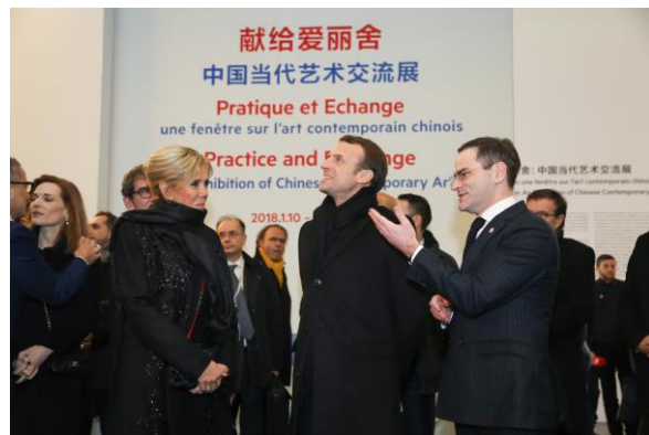
2018 年 1 月，法国总统埃马纽埃尔·马克龙与总统夫人在 UCCA 馆长田霏宇的陪同下参观 UCCA。

这些创作于 1893 至 1921 年间的作品，共同展示了这位现代艺术史上最为大胆、最具原创性、最为多产的天才——毕加索的艺术创作的形​​成与演变过程。此次展览由国立巴黎毕加索美术馆藏品总监艾米利娅·菲利普策划，并专为此次在中国于 UCCA 的呈现而进行构思设计与组织。