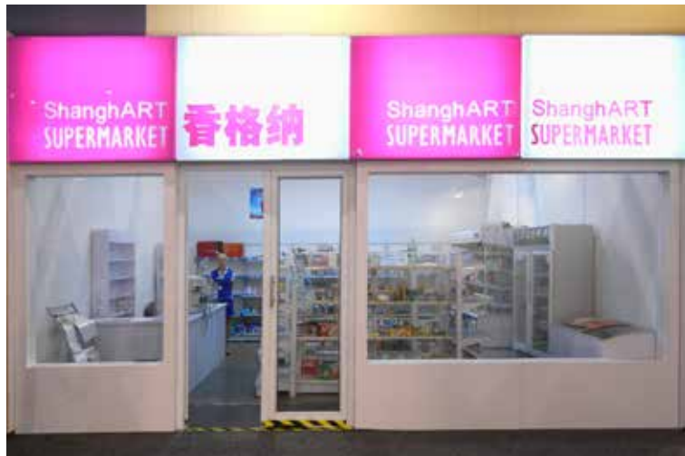
▲ 徐震，《香格纳超市》，2007，项目，15.7 x 11 x 4.7 米。

《香格纳超市》项目将一个货备充足的中国超市安置在画廊或博览会的空间中，此商店向观众开放，可以随意浏览货架、在收银台付款购买商品，而这些商品却是只有包装没有内容的空壳，这也许就像是当今的艺术生态。此项目于2007年在巴塞尔迈阿密艺术博览会上首次展出，超市内的空壳包装作为艺术品销售，映射着当时正处于膨胀期的当代艺术市场，揭示了价格与价值之间的深层关系。