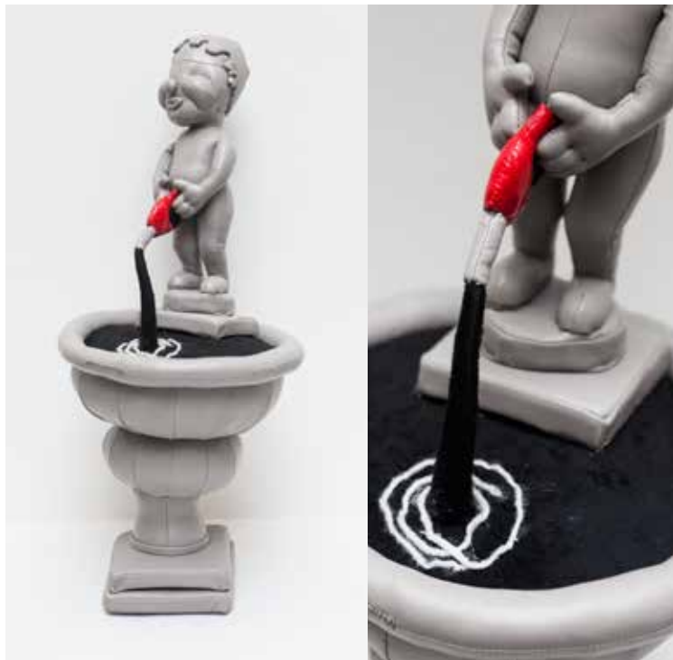
▲ 徐震，《昂贵的前列腺》，2013，限量版玩具（布、辅料），28 x 28 x 62 厘米，没顶公司出品。

由没顶公司出品的多数作品都包涵着一些恶作剧式的符号，被强制性地置入极端暴力、色情或有意冒犯的语境中。在限量版玩具系列中，没顶公司制作了一系列成人倾向的玩具，例如：一个流浪汉（玩具的标题表明“他”是一位艺术家）自愿提供一美元一次的“肮脏性爱”，或是一个有着本·拉登脑袋的劲量电池玩具兔等。在《聚餐》中，没顶公司收集并拼贴了一些政治卡通，随意地将它们与儿童动漫和其他波普文化符号杂糅并置，形成对西方当代艺术标准化实践的无聊化讽刺。