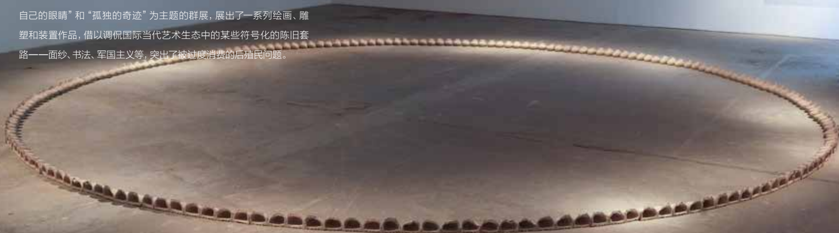
没顶公司，《完美的体积》，2009，装置（军靴100双），尺寸可变。

2009年，没顶公司为一群假想出来的中东当代艺术家策划了以“看见自己的眼睛”和“孤独的奇迹”为主题的群展，展出了一系列绘画、雕塑和装置作品，借以调侃国际当代艺术生态中的某些符号化的陈旧套路——面纱、书法、军国主义等，突出了被过度消费的后殖民问题。