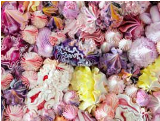
▲ 徐震，《天下-1802TV2312》，2013，装置、绘画，180 x 250 x 12厘米，没顶公司出品。

在《光源》系列中，欧洲大师的经典作品被复制并添加了一簇高光。这些由专业人员复制的绘画，原图像均来自于没顶公司的朋友们在严禁使用闪光灯拍照的世界级博物馆中拍摄的照片，画面上曝光的视觉效果是对普通的博物馆参观者和艺术品之间的关系 的嘲弄，也是对所谓公认“优越的艺术体验”的道德瓦解。