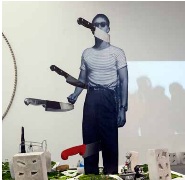
▲ 徐震，《一切都和时间一样是物品，因而一切被生产出来的物品均可被看作凝固的时间。》材料：知青图片、各种刀，2012，装置，220 x 349 x 5厘米。没顶公司出品。

在另一些作品中，没顶公司频繁地质疑艺术生产的既成体系及当代艺术范畴内的固有认知，例如：制作一系列雕塑，拍摄照片，然后立刻拆卸原作；这些作品的晦涩题目都引用自经典哲学文本，故意引诱那些依赖理论的观众陷入毫无意义的过度阐释。事实上，这样的“作品”与其它物件或复制品并无区别，本身就是一种概念上的否定，消解了对艺术作品唯一性的强求和摄影的价值。