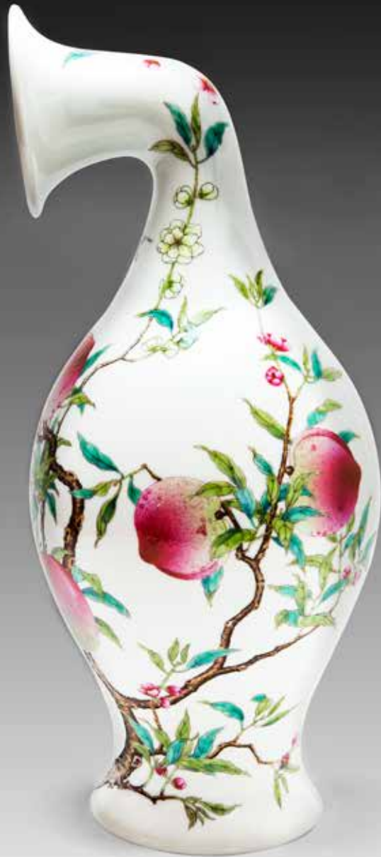
▶ 徐震，《没顶曲颈瓶—清乾隆粉彩九桃天球瓶》，2013，装置（陶瓷），42 x 42 x 58厘米，没顶公司出品。